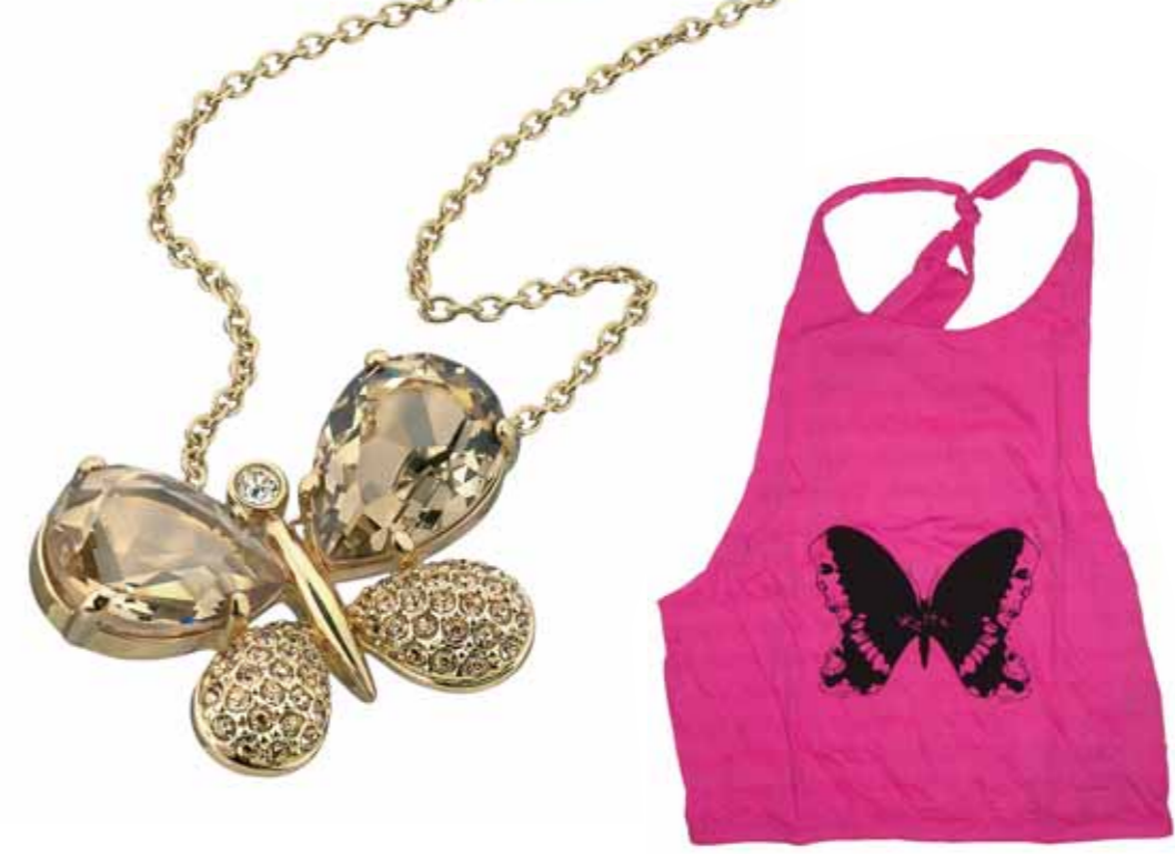
1/ VASARI Colgante 2/ KULTE Camiseta. 3/ CUSTO BARCELONA Campaña Publicidad Primavera/Verano 06