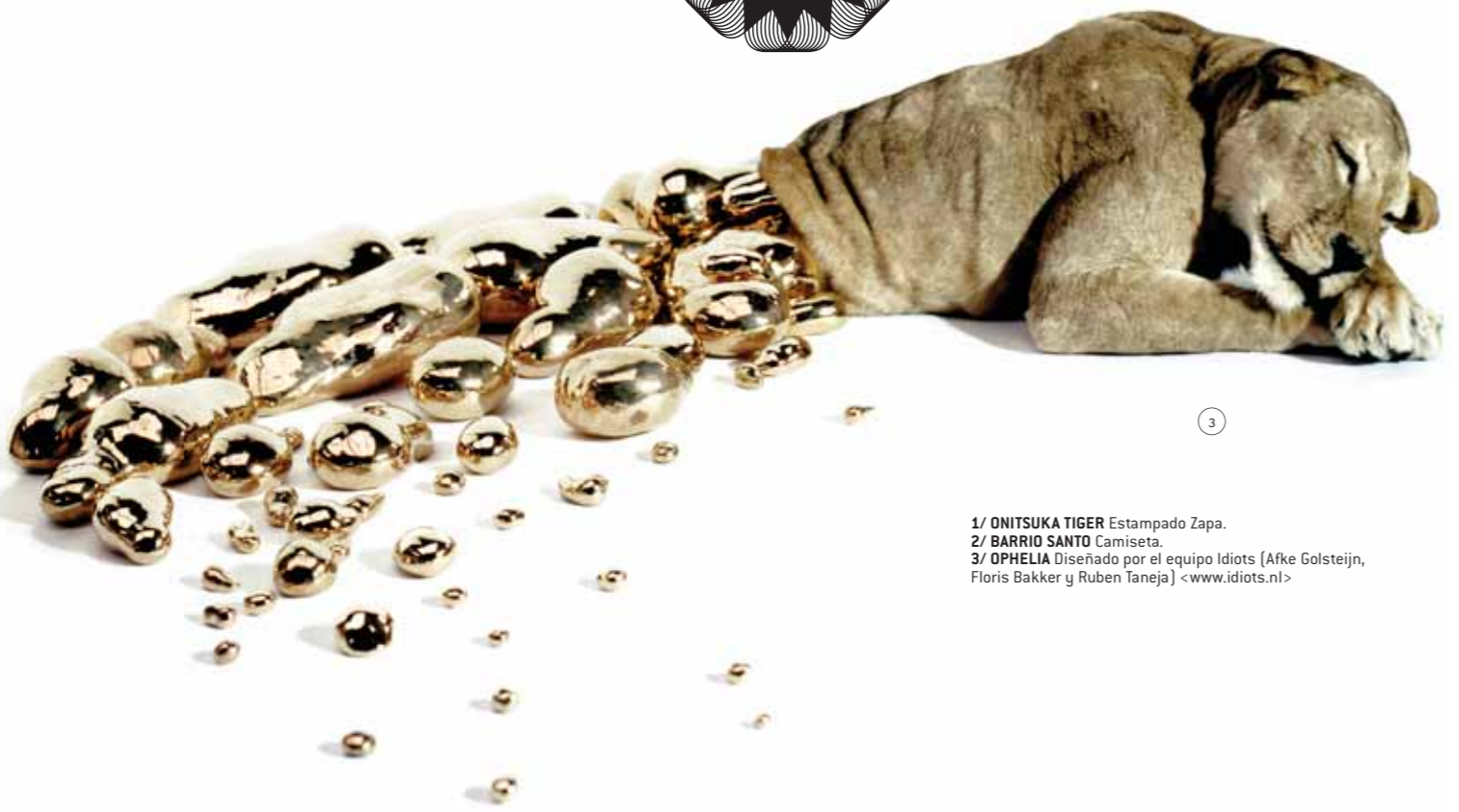
1/ ONITSUKA TIGER Estampado Zapa. 2/ BARRIO SANTO Camiseta. 3/ OPHELIA Diseñado por el equipo Idiots (Afke Golsteijn, Floris Bakker y Ruben Taneja) <www.idiots.nl>