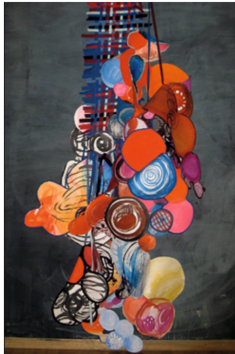
MARINA DE CARO. Penser l'utopie (Detalle).