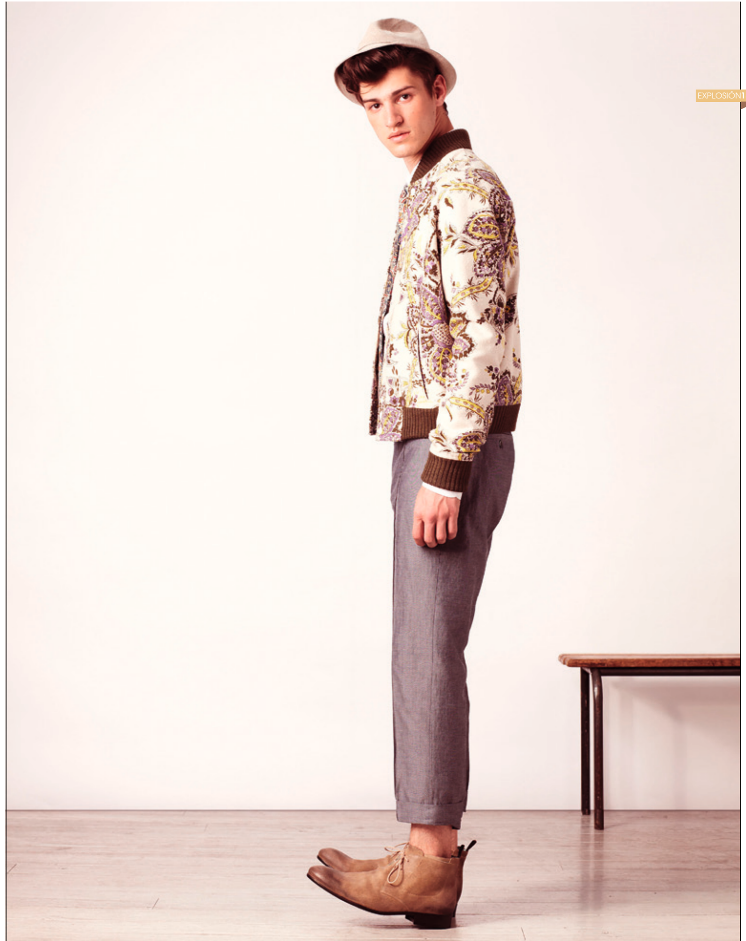
PAUL & JOE Total Look Colección Primavera Verano 2011 (913 081 393) <www.paulandjoe.com>

GYPSY O GIPSY, ROMANÍ O ROM, EGIPTANO O GITANO. TAMBIÉN SE LES LLAMA ZÍNGAROS O BOHEMIOS, YA QUE PARECE SER QUE ENTRARON EN EUROPA EN EL SIGLO 15 CON UN SALVOCONDUCTO DEL REY DE BOHEMIA. NOSOTROS LES CONOCEMOS COMO GITANOS, UNA PALABRA QUE DERIVÓ DE "EGIPTANO" PORQUE SE CREÍA QUE PROCEDÍAN DE EGIPTO. AUNQUE SUS ORÍGENES SIGUEN SIN ESTAR MUY CLAROS, LA VERSIÓN MÁS ACEPTADA ES QUE SON UN PUEBLO ORIGINARIO DE LA INDIA, QUE SE EXTENDIÓ LUEGO POR MUCHOS OTROS PAÍSES, Y QUE, AÚN HOY, SIGUE CONSERVANDO SU CULTURA Y UNO DE SUS PRINCIPALES RASGOS: EL NOMADISMO. SON UN PUEBLO TOTALMENTE INDEPENDIENTE Y SIN ATADURAS DE NINGÚN TIPO. SI SU FILOSOFÍA DE VIDA NOS GUSTA, SU ESTÉTICA TODAVÍA MÁS. LO GYPSY INSPIRA A CREATIVOS DE MUY DISTINTAS DISCIPLINAS, DESDE DISEÑADORES DE MODA, A MÚSICOS O ARTISTAS. TODO ALREDEDOR DE SU CULTURA PUEDE PARECER EXCESIVO, PERO TAMBIÉN ES APASIONADO, COLORIDO Y SÍ, CAÓTICO. EN ESTE NÚMERO NOS SENTIMOS LLENOS DE ESPÍRITU NÓMADA, ASÍ QUE YA TOCABA HACER UN PEQUEÑO HOMENAJE VISUAL DE INSPIRACIÓN GYPSY. PORQUE LO CREAS O NO, EL GYPSY ES EL NEW BLACK.