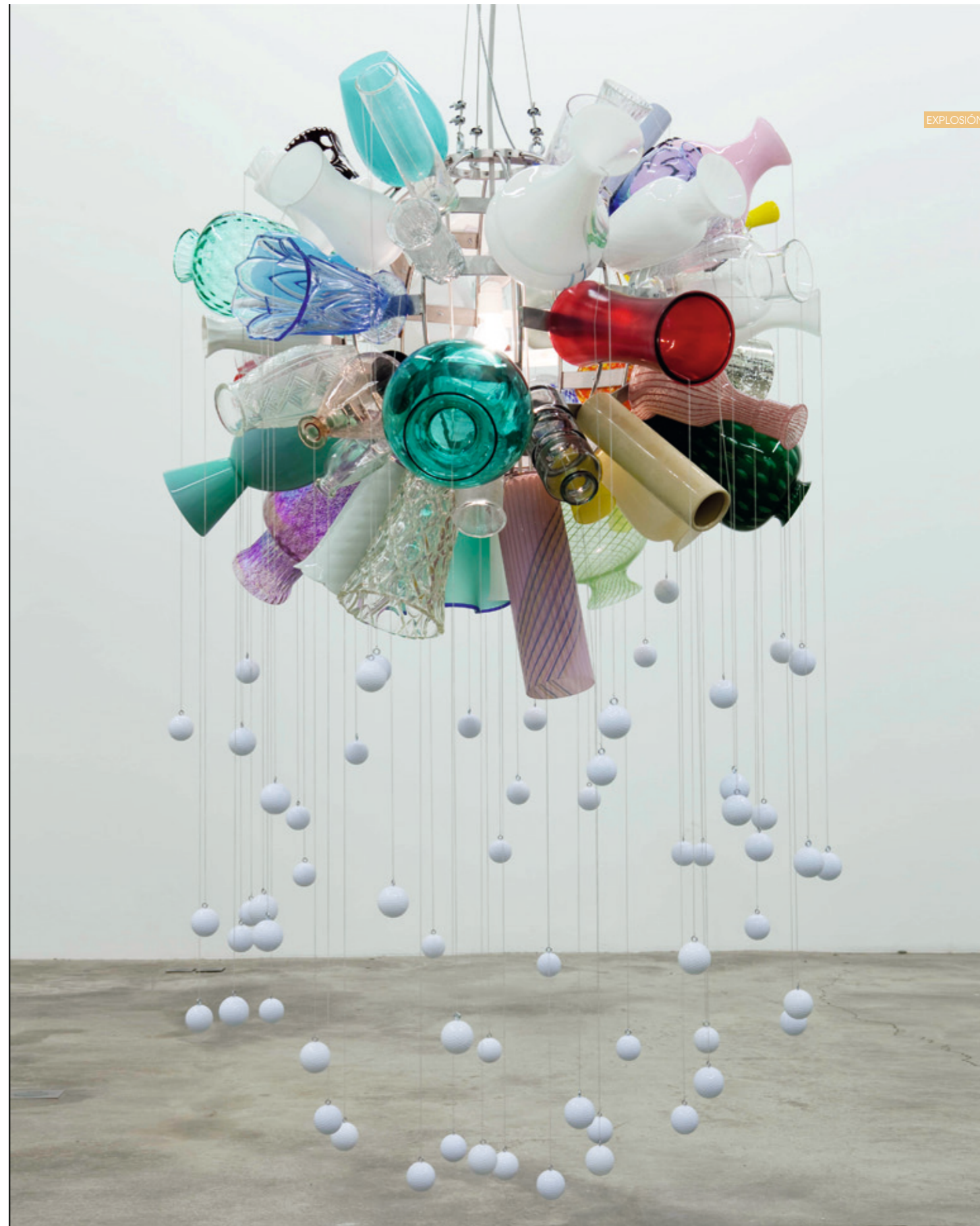
01/ RACHEL HARRISON. Claude Levi-Strauss, 2007 02/ CARDBOARD COVERING. Manta de cartón. Diseño de Diane Steverlyncx <www.dianesteverlyncx.be> 03/ CONSPIRADORAS. Broche Chapa Conejo Colección Primavera Verano 2011 <www.conspiradoras.com> 04/ THOMAS SABO. Anillo Rana con Syn Blanco, Zirconia y Onyx Colección Primavera Verano 2011 <www.thomassabo.com> 05/ STELLA MCCARTNEY. Total Look Colección Primavera Verano 2011 <www.stellamccartney.com> 06/ GIOSEPPO. Zapa Mujer Modelo Tamil. Colección Primavera Verano 2011 <www.gioseppe.com>. 07/ ANDREA GALVANI. La morte di un'immagine #5, 2006